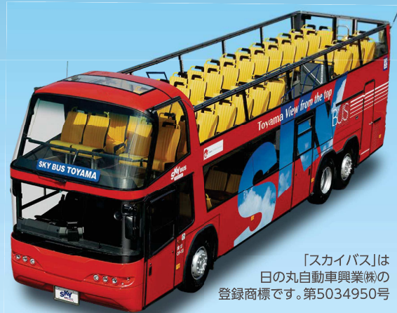
「スカイバス」は 日の丸自動車興業株式 登録商標です。第5034950号